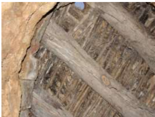
تصویر شماره ۴. سقف زاغه که با درخت سنجد درست شده است (عکاس: پژوهشگر - بهار ۹۷)

دشمن اصلی زاغه‌ها آب باران و برف است. در باور اهالی روستا نسبت به زاغه این اعتقاد وجود دارد، که اگر در زاغه‌ها به صورت مستمر دام نگهداری شود، در اثر گرمای بدن و دم و بازدم دام‌ها، زاغه به اصطلاح می‌پزد و سطح داخلی زاغه کمی سفت می‌شود. اگر زاغه‌ها به مدت ۲ سال، خالی از حیوان (دام) باشد و کسی به فکر ترمیم و حفاظت از آنها نباشد، به مرور در اثر آب باران و برف، تخریب شده، فروریخته و از بین می‌روند. در اصطلاح محلی به این وضعیت «زاغا خاملار» ۱ یعنی زاغه خام و سست گفته می‌شود.