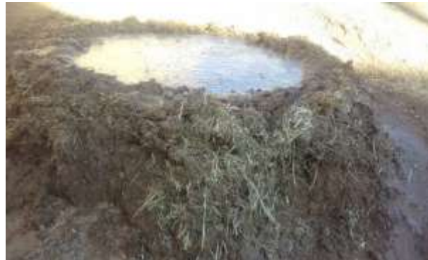
تصویر شماره ۸. در حال آماده کردن سواخ با خاک - کاه گل - نمک و آب زاغه (عکاس: پژوهشگر - بهار ۹۷)

مسیر آب ناودان‌ها که در اصطلاح محلی به آن‌ها «ناخورچا» ۱ می‌گویند هر ساله هنگام سواخ کردن بایستی مورد بازبینی و بازسازی و مرمت قرار بگیرد (تصویر شماره ۱۱).