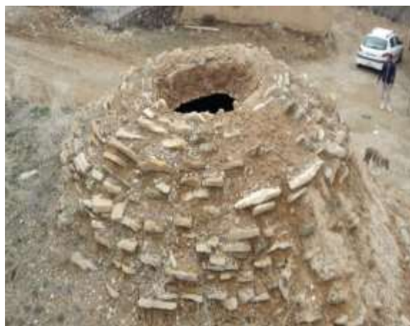
تصویر شماره ۶. چیدمان سنگ، خشت و گل در روی سقف از زاویه بیرونی زاغه

به این صورت که در اثر بارش برف و باران های زیاد سطح بیرونی زاغه ها تخریب شده و آب به زاغه ها نشت می کند. در اثر این امر دیواره داخلی زاغه ها و همچنین سقف زاغه مرطوب شده و در اصطلاح محلی «پوشته» ۱ می کند یا می اندازد. در این وضعیت دیواره ها و سقف آب گرفته پس از خشک شدن، خاکش سست شده و فرو مییزد (تصویر شماره ۷).