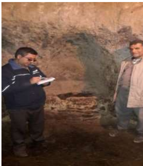
تصویر شماره ۱۴. آخور اسب زاغه (بهار ۹۷)

• آخور! برای تغذیه دامها، داخل هر زاغه محل‌هایی برای قرار دادن علوفه تعبیه می‌شود که در گویش محلی به آن آخور می‌گویند. آخورها در زاغه‌ها بر حسب نوع نگهداری نوع دام و سن‌شان فرق می‌کنند. زاغه‌هایی که در آن‌ها اسب و قاطر نگهداری می‌شد به صورت طولی و در دل دیواره زاغه‌ها از بالا به پایین حفر می‌شود (تصویر شماره ۱۴)؛ ولی در زاغه‌هایی که در آن‌ها گوسفند و بز و نوزادان آن‌ها را نگه می‌دارند به صورت افقی و در ارتفاعی متناسب با سن و نوع دام از کف زاغه‌ها تعبیه شده تا دام‌های ضعیف و کم سن دهانشان به علوفه برسد. آخور بز با آخور گوسفند تفاوت دارد چرا که بز حیوانی بازی‌گوش و در اصطلاح محلی زیانکار است؛ بنابراین برای اینکه وارد آخورها نشود یک تنه درخت به صورت افقی به موازات و کمی بالاتر از سطح آخورها به عنوان مانع نسب می‌شود. برخی از آخورها را به صورت یک دست از دل سنگ بستر و یا خاک زاغه‌ها تراشیده یا حفر می‌کردند. در غیر این صورت آخورها را از خشت و سنگ و گل در کف زاغه‌ها درست می‌کردند (تصویر شماره ۱۵).