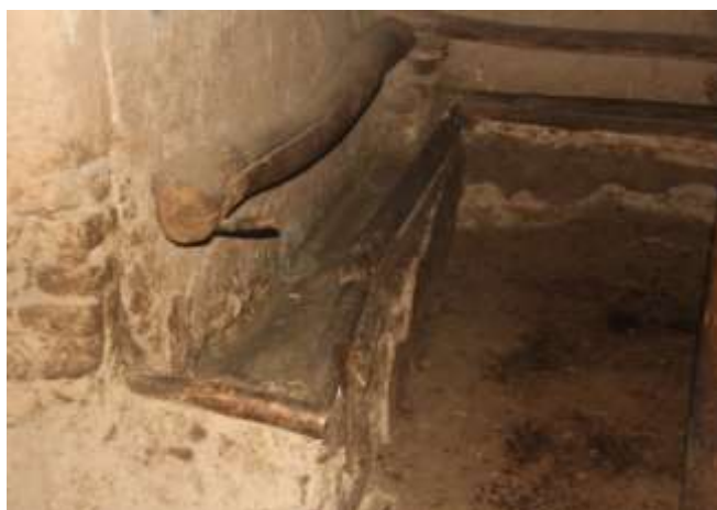
تصویر شماره ۱۵. آخور گوسفند و بز زاغه (عکاس: پژوهشگر - بهار ۹۷)

• دخمه (کُهل): دخمه یا در اصطلاح رایج اهالی دورباش «کُهل» ۱ را اکثراً در نزدیکی دهنه بزرگ و درب ورودی و در دل دیوار زاغه‌ها، مکانی به عمق ۱ الی ۲ متر و به ارتفاع ۱۷۰ سانتی‌متر از کف زمین به عنوان محل ذخیره پهن و فصولات حیوانی حفر می‌کنند. جهت جلوگیری از پای-کوبی و آلوده شدن پهن و فصولات به عنوان سوخت دامی توسط دام‌ها، آن‌ها را در دخمه‌هایی در دل زمین نگهداری می‌کنند. البته ممکن است در زاغه‌ها چندین دخمه حفر شود، که علاوه بر نگهداری و ذخیره سوخت دامی، محلی برای قرار دادن کرسی، سبد، سنگ نمک و ابزارهای مورد نیاز دیگر باشند (تصویر شماره ۱۶). ارتفاع و عمق این دخمه‌ها متغیر بوده و رابطه مستقیمی با بُعد خانوار، سطح اقتصادی و تعداد دام‌های خانوارها دارد. دخمه‌ها توسط افرادی که زاغه را ایجاد می‌کنند به وجود می‌آید. تنها وسیله برای درست کردن دخمه، قازما می‌باشد. درست کردن دخمه زمان بیشتری را می‌طلبد. فرد سازنده ابتدا به وسیله قازما، خطی به صورت گنبدی شکل بر روی دیوار زاغه می‌کشد و سپس شروع به کندن دیوار می‌کند. در پایان، فرد سازنده با دست بر روی دیواره دخمه می‌کشد. هدف از این کار صاف بودن دیواره دخمه می‌باشد.