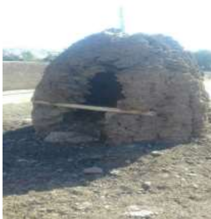
تصویر شماره ۲۶. کوشک (عکاس: پژوهشگر - بهار ۹۷)

بردن احشام به مسافت‌های دور و بالای کوه‌ها جهت چرا و برگردان آن‌ها به سمت روستا راحت‌تر و سریع‌تر است تا گاو؛ چرا که آن سنگین بوده و کند حرکت می‌کند و چوپان را به زحمت می‌اندازد. محل نگهداری گوسفند، بز، ماده، بز ماده و بز نر در زاغه‌ها مشترک نبوده و از هم