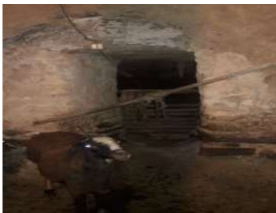
تصویر شماره ۱۹. چپر (عکاس: پژوهشگر - بهار ۹۷)

کارکردهای مهم آن در زاغه‌ها اشاره و تأکید داشتند. چپر به عنوان درب و جهت ممانعت از تداخل دام‌ها در ابتدای دهنه یا ورودی هر زاغه نسب می‌شود. چپر‌ها را در قدیم به علت کمبود چوب درخت از شاخه‌های جوان و منعطف درختان که در اصطلاح محلی به آن چرپخ می‌گویند، می‌بافتند. امروزه اثری از آنها نمانده، بلکه نوع چوبی آن را در زاغه‌ها مورد استفاده قرار می‌دهند. کارکردهای عمده چپر دو نوع است. کارکرد اول به عنوان حائل و جداکننده دام‌ها و مانع برای فرار و تداخل دام‌ها به کار می‌رود و دومین کارکرد چپر، اینکه با بافت زاغه‌ها تناسب دارد، به طوری که باید هوای زاغه‌ها در گردش باشد و هوا و بوی بد از طریق دریچه‌های بالای سقف زاغه‌ها خارج و هوای خوب و سالم و پاکیزه در زاغه‌ها در جریان باشد. اکثراً چپر را از چند تکه تخته و الوار درخت به صورت یک چهارچوب درست می‌کنند. کمبود چوب درخت و ارزشمند بودن آن به عنوان الویت اول جهت سوخت و تأمین گرما را نمی‌توان در شکل‌گیری ساختار فعلی «چپر»‌ها نادیده گرفت. بنابراین شکل فعلی «چپر» متناسب با ریخت و بافت و برطرف‌کننده نیاز زاغه‌ها و هماهنگ با امکانات (وجود چوب درخت) محدود طبیعت روستای دورباش می‌باشد. برای همین است که همچنان به شکل اولیه و قدیمی خود باقی مانده است. آنچه که در مورد «چپر» باید به آن توجه کرد این است که چپر یک درب کاملاً پوشیده و مسدود نیست. همیشه قسمتهایی از آن باز است تا هوای زاغه‌ها بتواند به صورت مطلوب در جریان باشد. در کنار اینکه مانع فرار و تداخل دام‌ها نیز هست (تصویر شماره ۱۹).