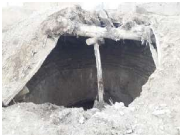
تصویر شماره ۷. سقف زاغه که بر اثر ریزش باران خراب شده است (عکاس: پژوهشگر - بهار ۹۷)

به این صورت که در اثر بارش برف و باران های زیاد سطح بیرونی زاغه ها تخریب شده و آب به زاغه ها نشت می کند. در اثر این امر دیواره داخلی زاغه ها و همچنین سقف زاغه مرطوب شده و در اصطلاح محلی «پوشته» ۱ می کند یا می اندازد. در این وضعیت دیواره ها و سقف آب گرفته پس از خشک شدن، خاکش سست شده و فرو مییزد (تصویر شماره ۷).