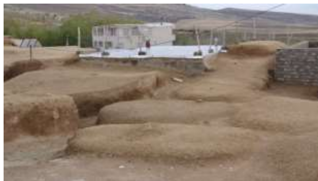
تصویر شماره ۱۰. سقف زاغه بعد از ترمیم به وسیله سواخ (عکاس: پژوهشگر - پائیز ۹۷)