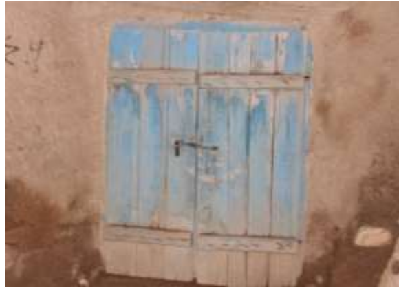
تصویر شماره ۱۷. درب زاغه از جنس چوب