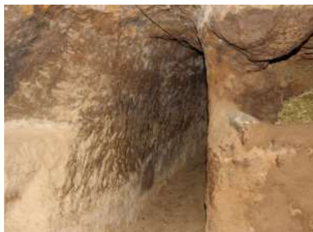
تصویر شماره ۳. دهنه زاغه (عکاس: پژوهشگر - بهار ۱۳۹۷)

● دهنه: مردم روستا، زاغه‌ها را در دل زمین حفر کرده و طی یک راهرویی طولانی و تنگ با سقفی کوتاه که به آن «دَهَنه» می‌گویند از سطح زمین به زیر زمین راه می‌یابند. طول و عرض دهنه برخی از زاغه‌ها کوتاه و برخی بلند حفر می‌شود. این امر رابطه مستقیمی با نوع دام و سطح اقتصادی خانوارها دارد. چه بسا خانواده‌هایی که اسب یا قاطر در مقایسه با کسانی که گوسفند و بز نگه می‌داشتند؛ طول و عرض دهنه‌ها را بلند (بزرگ) حفر می‌کردند و همچنین کسانی که از عهده هزینه‌های حفر دهنه‌های بلند و مرتفع بر نمی‌آمدند، ترجیح می‌دادند که ارتفاع دهنه‌ها را کوتاه حفر کنند. چون که حفر دهنه‌های بلند یعنی طول کشیدن فرآیند حفر زاغه‌ها و در نتیجه هزینه‌ها بالا می‌رفت و پرداختش از عهده خانواده‌هایی که تمکن مالی بالایی نداشتند خارج بود. دهنه بیشتر و ارتفاع دهنه بالاتر نشانه متمول بودن مالک محسوب می‌شد. چرا که ارتفاع بالاتر این را می‌رساند که وی اسب و قاطر و گاو دارد و تعداد دهنه بیشتر یعنی تعداد زیاد زاغه و این یعنی وی تعداد دام بیشتری دارد (تصویر شماره ۳).