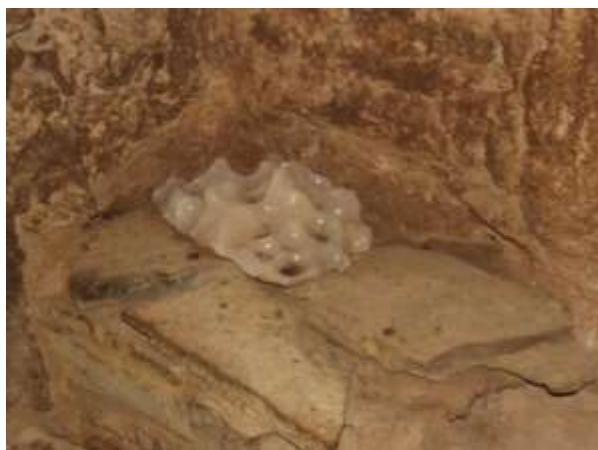
تصویر شماره ۲۲. داش دوز (عکاس: پژوهشگر - بهار ۹۷)

• چیچک داشی ۱ (دفع زخم چشم با سنگ آهک): اهالی معتقدند که که نامحرم و غریبه را نباید به زاغه راه دهند تا مبادا از تعداد دامها و راههای زاغه مطلع شود. همچنین برای مقابله با چشم زخم افراد شور چشم و حسود و شهره به زخم چشم سعی می کنند آنها را نیز به داخل زاغهها راه ندهند. به همین خاطر در ورودی اکثر زاغهها داخل دیوار را کمی کنده و قطعه سنگی سفید از جنس سنگ آهک رسوبی به نام «چیچک داشی» (سنگ آبله) قرار می دهند. روستائیان بر این باور هستند که با وجود این سنگ در زاغهها، زخم چشم و نظر افراد حسود به دامهایشان خنثی و بی اثر خواهد شد. همچنین معتقدند که با وجود این سنگ حشرات موزی به زاغهها راه پیدا نخواهد کرد (تصویر شماره ۲۳).