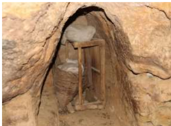
تصویر شماره ۱۶. دخمه (بهار ۹۷)