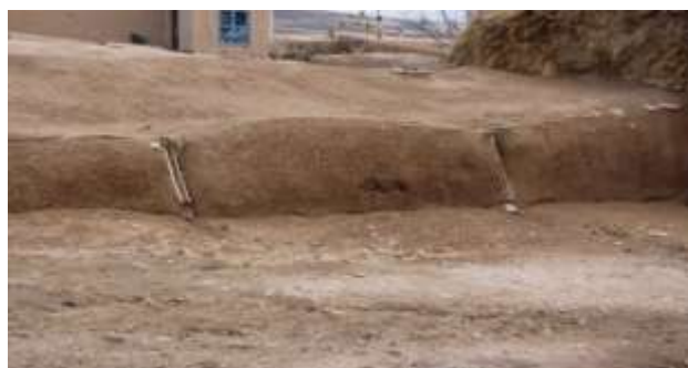
تصویر شماره ۱۱. سقف زاغه که توسط اهالی سواخ شده و مسیر آب توسط ناخورچا (عکاس: پژوهشگر - بهار ۹۷)

● پاجا: جهت تهویه مطلوب هوای داخل زاغه‌ها دریچه‌ای در سقف تعبیه می‌شود به ابعاد ۲۰ در ۲۰ سانتی متر که به آن در اصطلاح گویش محلی پاجا می‌گویند. هر سقف زاغه برای خودش یک پاجا دارد (تصویر شماره ۱۲). کارکرد اصلی پاجا در زاغه‌ها دو مورد است یک تهویه هوای زاغه‌ها و دوم تأمین روشنایی زاغه‌ها. پاجا باهریک از عناصر دیگر زاغه تناسب و هماهنگی مطلوبی دارند. چرا که «چپر»ها با دارا بودن منافذ و دریچه‌هایش هماهنگ با پاجاها بوده و با باز شدن پاجاها گردش هوا از راه چپرها به صورت کامل و مطلوب صورت می‌گیرد. اهالی روستا هر صبح دریچه‌ها را باز می‌کنند و در کنار آن برای تهویه سریع هوای داخل زاغه‌ها درب دهنة اصلی را