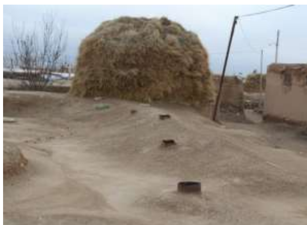
تصویر شماره ۱۳. پاچا از سقف زاغه در هنگام صبح که برای تمیز بودن هوا باز شده است (عکاس: پژوهشگر - بهار ۹۷)