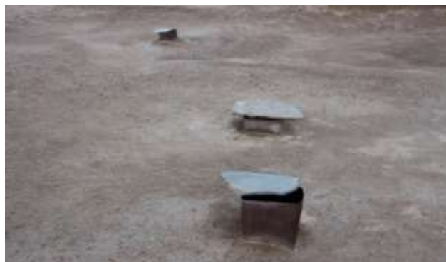
تصویر شماره ۲۰. بسته شدن خروجی پاچا با تخته سنگ یا پاچانن داشی (عکاس: پژوهشگر - بهار ۹۷)

• درپوش بالای زاغه: برای گرم نگهداشتن فضای داخل زاغه‌ها و همچنین برای جلوگیری از ریزش برف و باران به داخل زاغه‌ها بخصوص در ایام سرد سال اهالی اقدام به پوشاندن دریچه‌های بالای زاغه‌ها (پاجاها) می‌کنند. جنس این پوشش معمولاً از سنگ یا چوب است. تخته سنگ روی پاچا را در اصطلاح محلی پاچانن داشی ۱ و تخته چوپ روی پاچا را، پاچانن تختسی ۲ می‌گویند. در فصول سرد سال جهت کیپ شدن دریچه‌ها و جلوگیری از حدر رفت هوای گرم زاغه‌ها پس از گذاشتن تخته سنگ روی دریچه‌ها را با پهن می‌پوشانند. گاهی برای کنه‌زدایی و انگل‌زدایی و مبارزه با آفات و حشرات پس از دود دادن زاغه‌ها به وسیله سوزاندن کرمه و عنبر نثار «مدفوع الاغ» برای چند ساعت دریچه‌ها را محکم و مسدود می‌کنند تا دود کاملاً اثر کند و پس از آن دریچه‌ها و درب اصلی زاغه‌ها را باز می‌کنند تا دود تخلیه شود. در مورد اینکه چه زمانی دریچه زاغه‌ها را می‌بندند، یکی از اهالی روستای دورباش می‌گفت: «... در فصول سرد سال وارد زاغه‌ها می‌شوم و اگر دیدم حیوانات نزدیک هم رفته و کز کرده باشند، متوجه می‌شوم که دمای زاغه‌ها پایین آمده و دام‌ها احساس سرما می‌کنند. بنابراین دریچه بالای زاغه‌ها را با تخته سنگ یا تخته چوب می‌بندیم. در فصل زمستان اکثراً دریچه‌ها را با تخته سنگ و تخته چوب می‌پوشانیم اما در فصول گرم سال دائم دریچه‌ها باز می‌گذاریم. در زمان بارش باران و برف و سرد شدن هوا دریچه‌های سقف با تخته‌های چوب و سنگ مسدود می‌کنیم...» (تصاویر شماره ۲۰ - ۲۱).