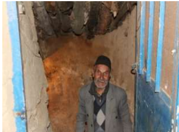
تصویر شماره ۱۸. درب زاغه از جنس فلز (عکاس: پژوهشگر - بهار ۹۷)

● چپر! سعی می‌شود درب اصلی که به دهنه راه دارد از چوب محکم و با دوام و یا از جنس آهن ساخته شود. درب ورودی زاغه‌های فرعی را در زبان محلی «چپر» می‌گویند. چپرها در ابتدای امر به عنوان یک فناوری ساده و ابتدایی به نظر می‌رسند. اما با مشاهده و مصاحبه با اهالی روستا و صاحبان زاغه‌ها متوجه موارد جالب و کاربردی از «چپر» شدیم که به اهمیت نقش و