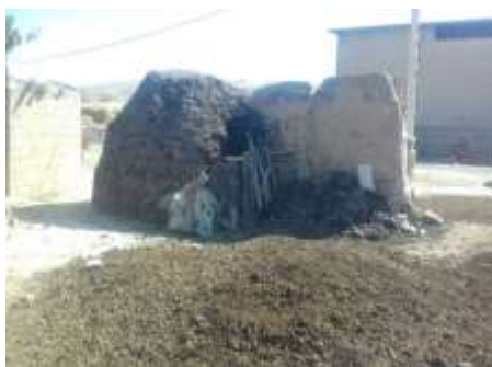
تصویر شماره ۲۵. کوشک

نگهداری دام‌هایی مانند گوسفند، بز، بسیار مناسب است. البته برخی از اهالی که گاو هم نگهداری می‌کنند ارتفاع و عرض دالان‌های زاغه‌هایشان را کمی پهن‌تر می‌تراشند تا برای عبور و مرور گاوها مشکلی پیش نیاید. اما با این کار هوای گرم زاغه‌ها بیشتر هدر می‌رود. البته اهالی بیشتر ترجیح می‌دهند که گوسفند و بز نگه دارند چرا که این دو حیوان سریع حرکت می‌کنند.