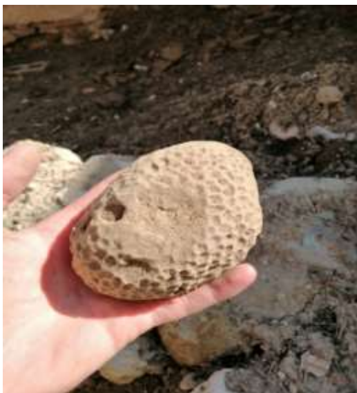
تصویر شماره ۲۳. سنگ آهک استفاده شده در زاغه برای زخم چشم

● کرمه ۱ : با آغاز آبان ماه در فصل پاییز، هوا در این منطقه به شدت سرد می‌شود. بنابراین دامها تا اوایل اردیبهشت ماه جهت چرای به دشت برده نمی‌شوند و در زاغه‌ها مانده و از جو و گاه و علوفه‌ای که ذخیره شده است، تغذیه می‌شوند. در این ۶ ماه فضولات دامها از کف زاغه‌ها پاک‌سازی می‌شود. بنابراین به مرور و با جمع شدن آنها و در اثر انباشت و پایکوبی و رطوبت، فضولات دامها فشرده شده و لایه ضخیمی به اندازه ۱۰ الی ۲۰ سانتی‌متر (بسته به تعداد دامها)، در کف زاغه‌ها به‌وجود می‌آید. مردان روستا در این فاصله ۲ بار اقدام به بریدن و تخلیه این فضولات از کف زاغه‌ها می‌کنند. مرحله اول، پس از ۶۰ روز ماندن دامها در زاغه و نرفتن به صحرا (اواخر آذرماه) و مرحله دوم یک ماه تا ۲۰ روز مانده به آغاز بهار (اسفند ماه). در فصل بهار با گرم شدن هوا با بیل، لایه‌های ضخیم فضولات را از کف زاغه‌ها جدا کرده و آنها را بیرون در مقابل آفتاب پهن می‌کنند تا خشک شوند. در اصطلاح محلی مدفوع گوسفند و بز را «قیخ» ۲ و به خشک و فشرده شده آنها «کرمه» یا «کمره» می‌گویند. جدا کردن کرمه‌ها کار بسیار مشکلی