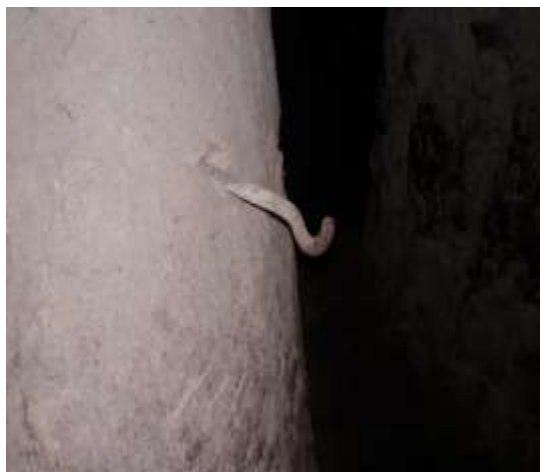
تصویر شماره ۲۸. میخ طویله (عکاس: پژوهشگر - بهار ۹۷)

● ایپ یا طناب: برای محکم قرار گرفتن درب زاغه‌های فرعی (چپرها) بر روی دیوار زاغه‌ها و ممانعت از ورود و خروج دامها، آن‌ها را به وسیله طنابی که یک سرش به چپر و سر دیگر آن به دیوار وصل شده می‌بندند. جنس طناب‌ها از ماده به‌خصوصی نیست و معمولاً از نخ یا پلاستیک است.