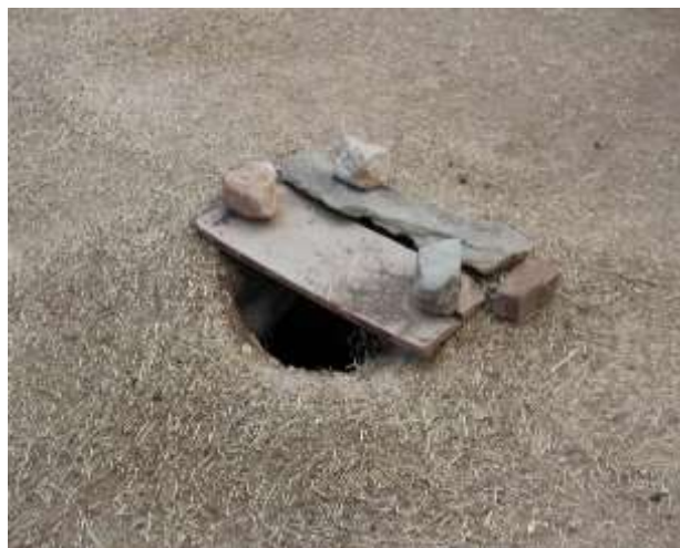
تصویر شماره ۲۱. بسته شدن خورجی پاچا با تخته چوب یا پاچائن تختسی (عکاس: پژوهشگر - بهار ۹۷)