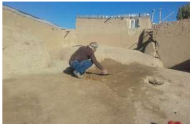
تصویر شماره ۹. استادکار در حال کشیدن سواخ با ماله بر روی سقف زاغه