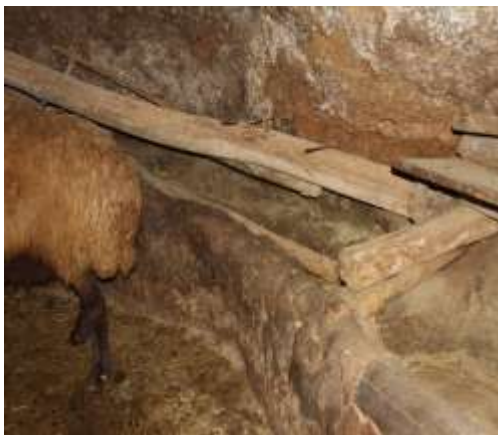
تصویر شماره ۲۹. الوار چوبی بالای آخور (عکاس: پژوهشگر - بهار ۹۷)

• الوار چوبی بالای آخور (آخور آقاچی) ۱ : یکی از ابزارهایی که در زاغه‌ها به کار می‌رود الوار چوبی است که بر روی آخورها قرار می‌گیرد. دام‌ها به‌خصوص بز بسیار بازی‌گوش هستند؛ بنابراین ممکن است به روی آخورها بپرند و علوفه داخل آخورها را با مدفوع و ادرار خود آلوده کنند. بنابراین برای ممانعت از این اتفاق یک الوار از جنس چوب در بالای هر یک از آخورها نصب می‌کنند، تا مانع قرار گرفتن دام‌ها در داخل آخور شود. برای تثبیت این الوار بر روی دیوار از میخ‌های بزرگ آهنی (طویله میخی) استفاده می‌شود (تصویر شماره ۲۹).