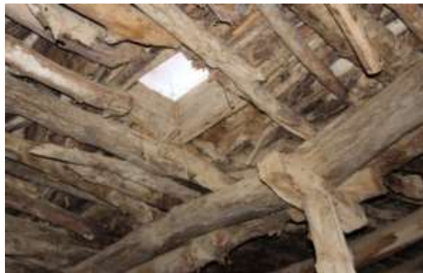
تصویر شماره ۱۲. پاچا

کاربرد دوم زاغه‌ها بحث نور و روشنایی است. هرچه سقف زاغه بلندتر باشد، نور بیشتری وارد زاغه شده و محیط داخل زاغه‌ها روشن‌تر می‌شوند. این باور محلی کاملاً جنبه علمی داشته چرا که اثبات شده است با دور شدن از منبع نور میزان و دامنه و شعاع روشنایی محیط بیشتر می‌شود و عکس این فرآیند نیز صادق است.