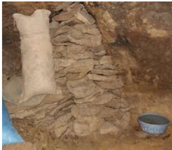
تصویر شماره ۲۴. کرمه که در داخل دخمه درون زاغه جای داده شدند (عکاس: پژوهشگر - بهار ۹۷)

است. کرمه‌های خشک شده توسط زنان روستا، در دخمه‌ی زاغه‌ها انباشته می‌شوند (تصویر شماره ۲۴).