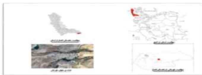
تصویر ۱. موقعیت روستای دورباش

اهالی روستای دورباش مسلمان و شیعه دوازده امامی می‌باشند. با توجه به شرایط سخت آب و هوایی و نبود زمین مساعد، اهالی به معیشت چند وجهی و محدود روی آورده‌اند. کشاورزی، باغداری، دامداری، زنبورداری و فرش‌بافی در این روستا رواج دارد. دختران روستا وقتی که به فصل سرد سال می‌رسند، قالی و گلیم را برپا کرده تا از فرصت به‌دست آمده جهت رفع مسائل اقتصادی خانواده بهره ببرند. شب‌های بلند پاییز و زمستان فرصت مناسبی است تا زنان توانمند و هنرمند روستا پودها را به تارهای دار قالی گره بزنند و در فعالیت اقتصادی خانواده دوشادوش مردان مددکار باشند. مالیکت دارایی در اختیار مرد خانواده است. به علت شرایط سخت اقلیمی و محدود بودن منابع آب و زمین مناسب، جمعیت مازاد آن به شهرهای بزرگ تهران، زنجان و ارومیه مهاجرت می‌کنند. دختران این روستا ترجیح می‌دهند با مردان روستاهای اطراف ازدواج کنند. شاید این تمهیدی برای جلوگیری از ازدواج درون‌گروهی و ممانعت از زایش کودکان معلول مادرزاد باشد. معیشت غالب اهالی روستای دورباش دامپروری است. بیشتر دام‌ها را به ترتیب گوسفند، بز، گاو و الاغ تشکیل می‌دهد. به‌همراه گله از چندین سگ برای پاسداری از گله‌هایشان در برابر دزدی و حمله گرگ‌ها استفاده می‌کنند. مرده‌های خود را پس از فوت در حیات منزل متوفی یا غسل‌خانه کنار قبرستان شسته و غسل می‌کنند و پس از کفن کردن به خاک می‌سپارند. برای درگذشتگان مراسم مجلس سوم، هفتم و چهلم می‌گیرند.