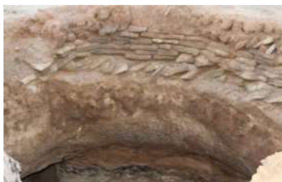
تصویر شماره ۵. چیدمان سنگ، خشت و گل در روی سقف از زاویه درونی زاغه (بهار ۹۷)

دشمن اصلی زاغه‌ها آب باران و برف است. در باور اهالی روستا نسبت به زاغه این اعتقاد وجود دارد، که اگر در زاغه‌ها به صورت مستمر دام نگهداری شود، در اثر گرمای بدن و دم و بازدم دام‌ها، زاغه به اصطلاح می‌پزد و سطح داخلی زاغه کمی سفت می‌شود. اگر زاغه‌ها به مدت ۲ سال، خالی از حیوان (دام) باشد و کسی به فکر ترمیم و حفاظت از آنها نباشد، به مرور در اثر آب باران و برف، تخریب شده، فروریخته و از بین می‌روند. در اصطلاح محلی به این وضعیت «زاغا خاملار» ۱ یعنی زاغه خام و سست گفته می‌شود.