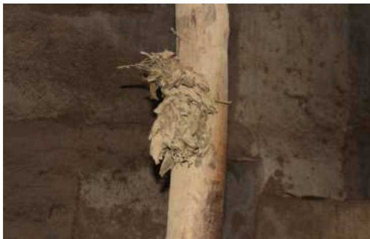
تصویر شماره ۲۷. برگ درخت گردو

جداست. چرا که بز نر و ماده‌اش در مقایسه با گوسفند حیوانی مهاجم و جنگ طلب است. چه بسا به تجربه دیده شده است که در همجواری گوسفند و بز و در اثر حمله بز، گوسفندان مصدوم یا کشته شده‌اند. بنابراین محل نگهداری بز و گوسفند در زاغه‌ها از هم منفک می‌شود و هر یک در - ای جداگانه نگهداری و محصور می‌شود. دوشیدن شیر دام‌ها در دو نوبت یکی، عصر زمان رسیدن گله از چرای و نوبت دوم، صبح زود قبل از اینکه گله به چرای برود، توسط زنان و دختران در زاغه انجام می‌شود. در فضای زاغه‌ها اکثراً تاریکی مطلق حکم فرماست. اما اهالی روستا قبل از مجهز شدن به انرژی برق از مشعل آغشته به روغن دنبه و یا از فانوس و چراغ گرد سوز و لامپ برای روشن کردن فضای زاغه‌ها استفاده می‌کردند. جهت مبارزه با آفات و حشرات موزی بر روی دیوارهای زاغه چند دسته برگ درخت گردو آویزان می‌کنند. و در ماه دوم بهار آن را آتش داده و فضای زاغه‌ها را دود می‌دهند و دوباره برگ‌های تازه درخت گردو به دیوار زاغه‌ها می‌آویزند. به باور اهالی جهت جلوگیری از چشم زخم یک دسته اسفند در ورودی دهنه و داخل زاغه‌ها نصب می‌کنند (تصویر شماره ۲۷).