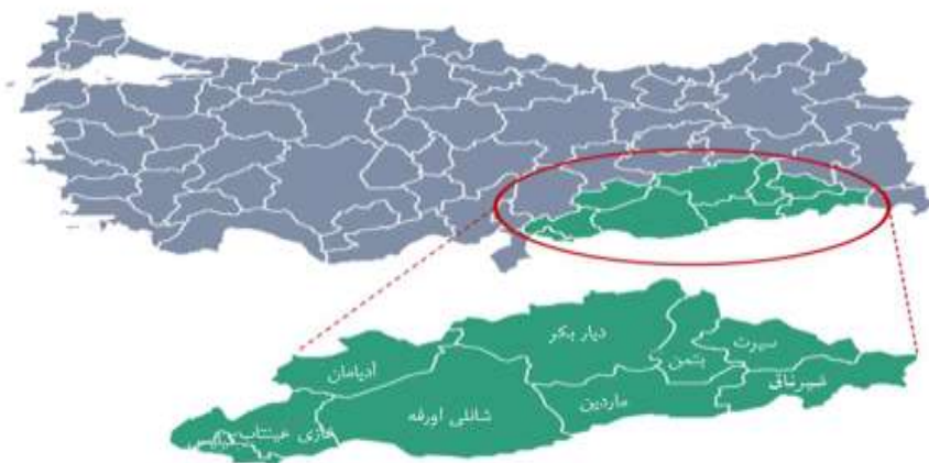
نقشه شماره ۱. موقعیت پروژه جنوب شرقی آناتولی (GAP)

فرات برای آبیاری و بالاتر از همه، تولید برق آبی، گسترش یافت تا نخستین طرح جدی توسعه اجتماعی با هدف اصلاح مشکلات سیاسی ایجادشده در جنوب شرق از راه یکپارچگی اقتصادی و اجتماعی بین کردها و دیگر مناطق ترکیه ایجادکنند (اوزکاهرامان، ۲۰۱۷: ۴۱۳). در واقع رهبران ترکیه در توسعه زیرساخت‌های آبی، امکان استفاده از جغرافیا و مهندسی برای رسیدن به اهداف خود به منظور حفظ یکپارچگی ملی و سرزمینی دنبال می‌کنند. در این باره برخی تحلیل‌گران بر این باور هستند که نیروی محرک اصلی در پس‌زمینه گپ نه توسعه اقتصادی و اجتماعی منطقه، بلکه بالعکس، باورهای نادرست مؤسسات امنیتی، مبنی بر تضعیف هویت کردها و پیروزی نظامی بالقوه از راه اجرای این پروژه، در درگیری‌های مسلحانه منطقه است (سچینکلشوک، ۲۰۱۷: ۳۹).